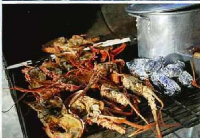
Noch mit Mast: der 44-Fuß-Racer „Caccia Alla Volpe“ (o. l.). Hahn im Korb: Damencrew mit Rastafari-Skipper (u. l.). Hecht im Karpfenteich: Volvo 70 „ABN Amro One“ (o. r.). Grillparty am Abend

D as Wasser in der Bucht vor English Harbour kocht. Start zum South Coast Race. Das Schiff perfekt im Timing, beim Schuss einen Wimpernschlag von der Linie entfernt. Mit ordentlich Druck im Tuch geht es auf den Kurs. Aber Achtung, die Holländer. Raum! Nicht mit uns. Dichter, dichter; dreh doch endlich an dieser verdammten Kurbel! Mensch, das war knapp! Wettkampfstimmung. Nach wenigen Minuten sind die Positionen fürs Erste vergeben. Das Feld hat sich arrangiert, das Adrenalin kann aus der Bilge gepumpt werden.